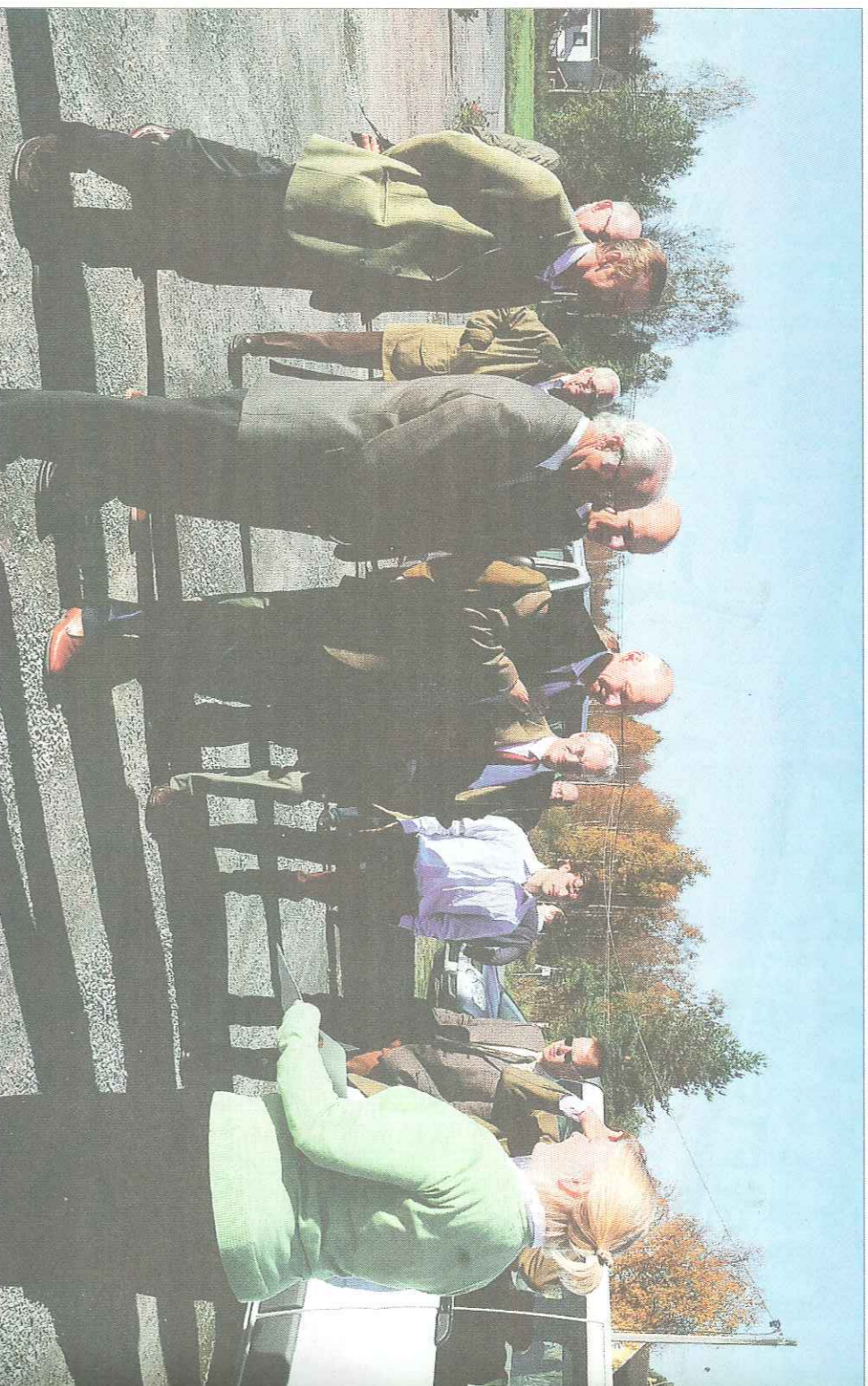
Kungen och prinsens avslutade tillsammans med övriga i jaktstället i Tornedalen med ett besök vid Kukkolaforsen. Johannah Spolander