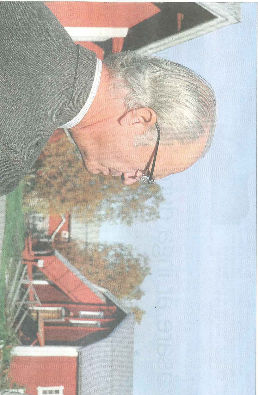
Kung Carl XVI Gustaf med sällskap hann med att besöka Kukkolaforsen innan de reste åter efter en helg fylld av jakt och fest.

tillfälle att visa upp sig och sin verksamhet från den allra soligaste sidan.